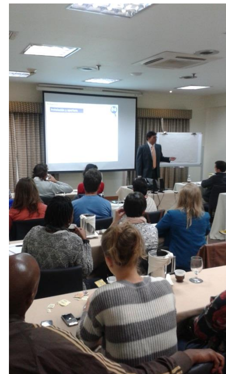
Foto: Capacitación en Bogotá Mayo/2014.

Desde Bogotá se desarrollaron tres capacitaciones presenciales y una virtual, y por razones de desplazamiento y tiempo, varios observadores internacionales recibieron la capacitación por parte de los coordinadores regionales de la MOE en el territorio donde observaron. Las tres capacitaciones presenciales las dirige el coordinador de Calidad de Elecciones con la ayuda del equipo de MOE Nacional y el Coordinador Internacional.