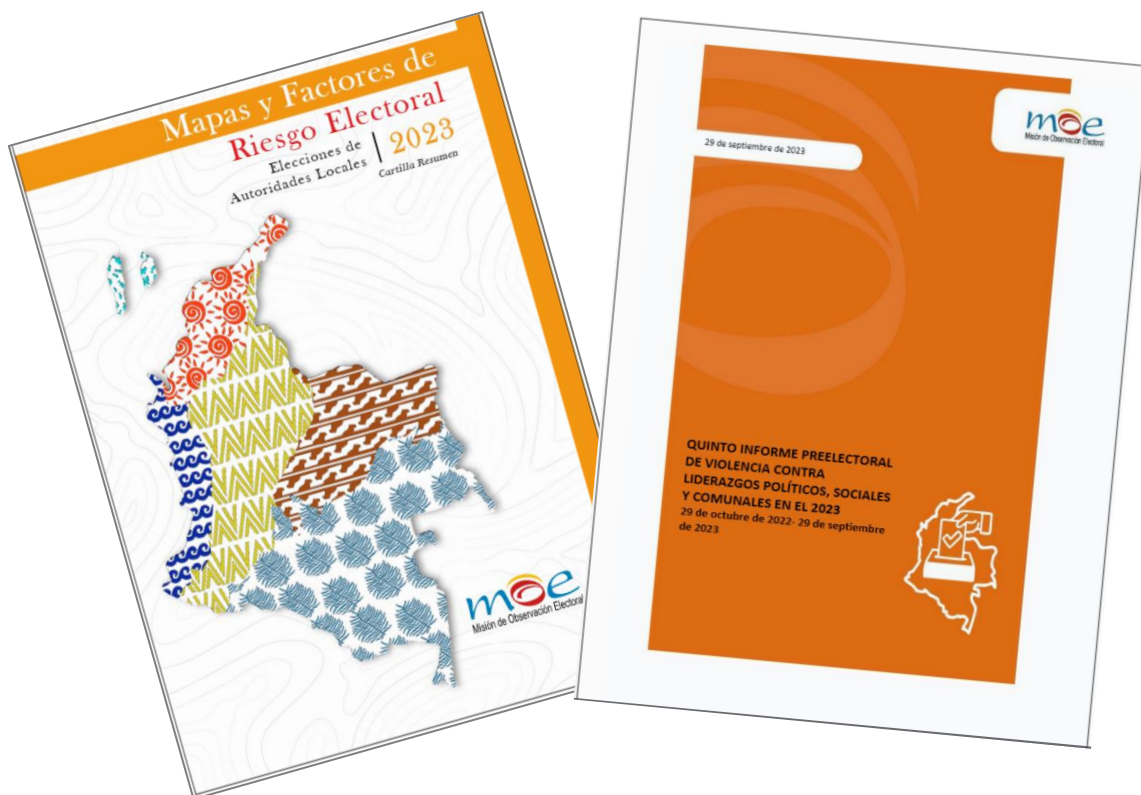
Mapas de Riesgo Electoral-MOE e informes de monitoreo a violencia contra liderazgos

El Observatorio hizo el lanzamiento, en Bogotá y en otras nueve ciudades, del libro Mapas y Factores de Riesgo Electoral Elecciones 2023 . Este mapa de riesgos logró identificar más de 300 municipios con algún nivel de riesgo por factores de indicadores de fraude electoral y factores de riesgo por violencia.