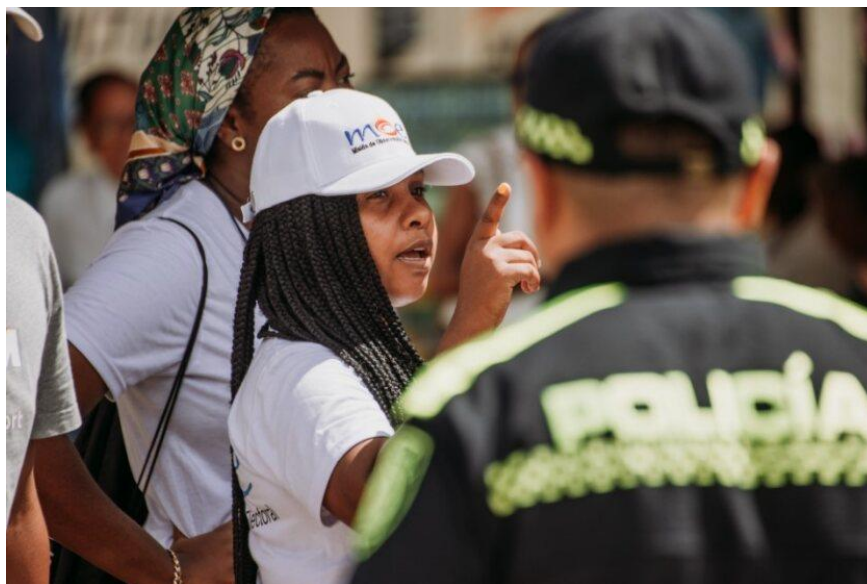
Despliegue de personas observadoras durante el 29 de octubre de 2023 – MOE-

Para el despliegue de la observación electoral, en el marco de las elecciones del 29 de octubre de 2023, contamos con más de 3.000 observadores, de los cuales el 58% eran mujeres, 41% hombres y 1% personas trans. La observación se desplegó en un total de 530 municipios, equivalentes al 83% del censo electoral. Adicionalmente, participó en este ejercicio un equipo de observación internacional integrado por 62 personas de 9 nacionalidades, éstas observaron en 10 municipios de 10 departamentos incluido el Distrito Capital.