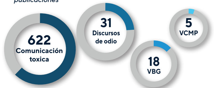
Ilustración 1. Caracterización de la muestra priorizada de publicaciones

» Las palabras violentas se concentran en repertorios de deslegitimación asociados al conflicto armado, complementados por estrategias de criminalización, estigmatización y patologización que construyen al adversario como un actor peligroso.