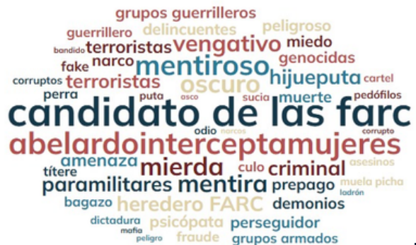
Ilustración 2. Palabras violentas

» Las palabras violentas se concentran en repertorios de deslegitimación asociados al conflicto armado, complementados por estrategias de criminalización, estigmatización y patologización que construyen al adversario como un actor peligroso.